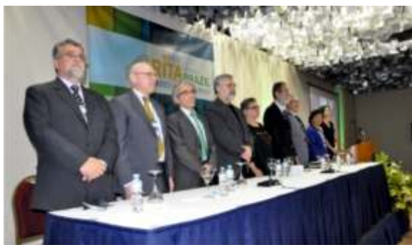
Mesa de abertura da XXIII RITA com representantes de instituições nacionais e internacionais

Assistente Técnico de Saúde do Instituto Pasteur Presidente do Comitê Organizador da XXIII (RITA). Vice-Presidente do Comitê Internacional da RITA Instituto Pasteur. São Paulo, SP – Brasil