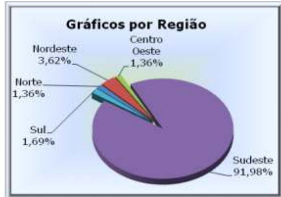
Figura 3. Participação das diferentes regiões do país no IX EIAL

Dentre as regiões que mais atenderam ao evento, destaca-se a região nordeste, que teve uma participação efetiva, conforme a Figura 3.