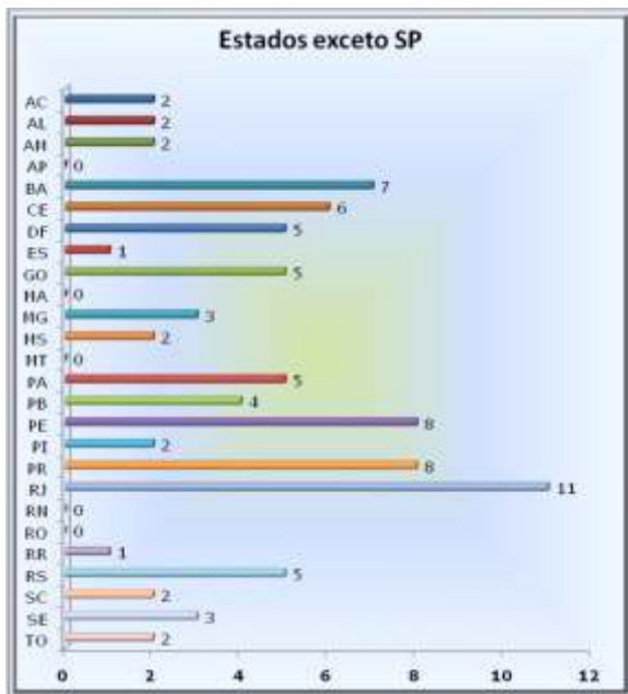
Figura 1. Estados participantes do IX EIAL

O evento é uma importante reunião para atualização e discussão de assuntos relevantes em saúde pública, junto aos vários parceiros do Instituto Adolfo Lutz. Os Laboratórios Centrais (LACEN), do Ministério da Saúde, tiveram uma importante participação no IX EIAL. Dentre eles, destacam-se os LACENs de Pernambuco, Alagoas, Goiás, Tocantins, Piauí, Macapá, Paraíba, Rondônia, Mato Grosso, Ceará e Sergipe, além da Fiocruz.